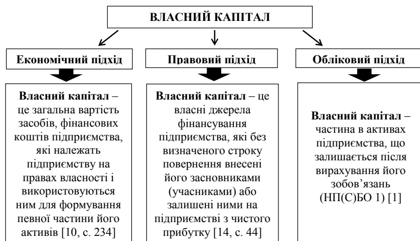
Рис. 1. Сутність власного капіталу: підходи трактування

Більшість вчених вважає, що власний капітал визначається вартістю майна суб'єкта господарювання, тобто чистими активами (різниця між вартістю майна